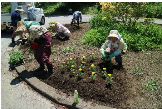
花壇を整備する参加者の方々

当日ご協力いただいた、小友町老人クラブの皆様や、地域の皆様、大変ありがとうございました。