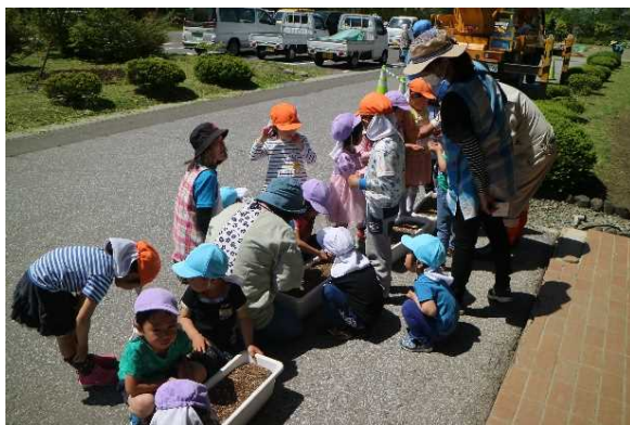
緑のカーテンの植える岩滝保育園児たち

※ 遠野市HPの小友地区センターのページで、小友地区センターだよりをカラーで見ることが出来ます。