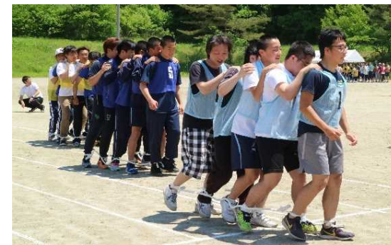
ムカデルーの様子