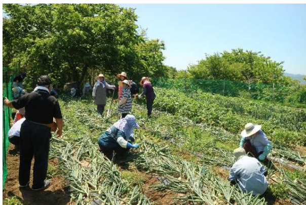
整備作業を行う更生保護女性の会の方々