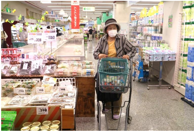
【写真】とびあで買い物を楽しむ参加者

今後は、参加者のアンケート結果を基に、より良い事業の発展を目指し、関係団体との協議を進めていきます。