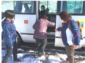
バスに乗る利用者

鱒沢地区では、12月6日(金)に、「まずざわ買物支援 わくわくバス」を実施しました。これは、地区まちづくり計画の基本方針の一つである「暮らしの安心」のワーキンググループで検討を進めてきた、交通手段の乏しい高齢者等を対象とした買い物支援で、これまでに、路線バスやタクシーの利用、近隣住民や親族による支え合いを妨げないように、地域の何名かの対象者に実態調査を行い、地域の実態をもとに検討を進めてきました。今回は、実施に係る課題等と反応を把握するために試験的に実施しました。 利用者からは好評をいただき、今後は車両の確保など継続して実施できるように検討を進めていきます。