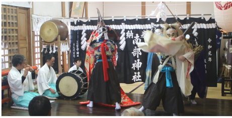
新嘗祭で舞を披露する様子

今回は、3地連協の平成31年度まちづくり一括交付金型モデル事業の実施した事業の一部をご紹介します。 宮守地区では、上宮守文化振興会(宮守1・2区)が一括交付金を活用し、昨年遠野遺産に認定された上宮守神楽保存会の神楽幕と権現幕を作成しました。 今回作成した幕には「南部神社」と記されていますが、今までの幕には「鍋倉神社」と記されていました。 同じ神社ですが郷社から県社とするために名称が改められた経緯があり、今回の作成にあたって幕の名称も改めたとのこと。 11月23日(土)に遠野市の南部神社で行われた新嘗祭では、新しく作成した幕が披露されました。