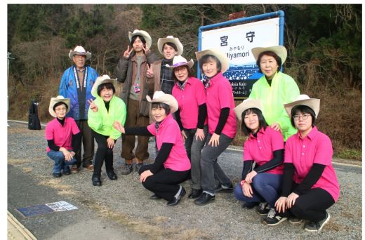
ずーっとプチエンジェルの皆さん

また、SL銀河の絶好の撮影スポットとなっているめがね橋周辺も多くの観客で賑わい、道の駅みやもりでは、ホットコーヒーや、名物のワサビ団子などのお振舞いも行われ、訪れた観客を温かく迎えていました。