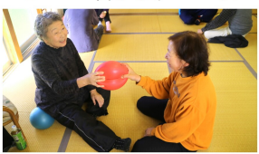
ボールを使った簡単筋トレ

達曽部地区では、11月12日(火)から22日(金)までの期間中、全7行政区集会所を会場に健康スポーツ事業「軽体操教室」を開催し、46名の地区民が参加しました。