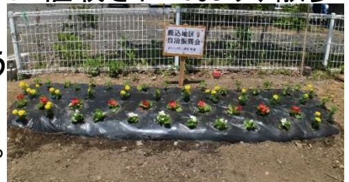
鹿込地区自治振興会の花壇

花いっぱい運動事業は、今年度は上宮守文化振興会、下郷地区自治会、新町自治振興会、鹿込地区自治振興会、岩根橋自治会で取り組んでいます。主に道路沿いに植栽されており、散歩をする人や車を運転するドライバーの方は、見たことがあるのではないのでしょうか？上記の自治会で合計約2,895本の花が宮守地区の花壇に植栽されました。