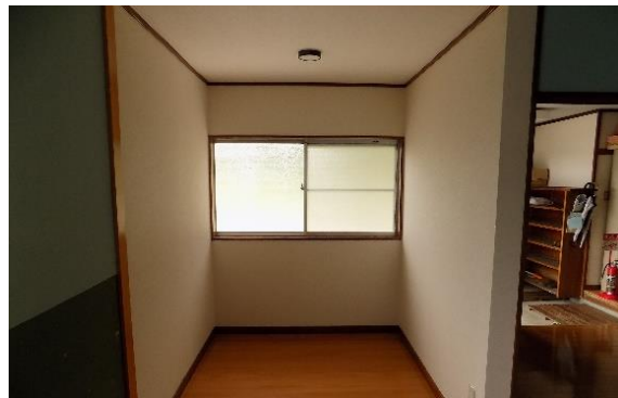
改修した厨房施設

下郷地区自治会では、厨房施設を改修し地域住民が快適に利用できるようにしたい！という思いから厨房施設の増築工事をしました。改修したことで、食器棚が移動し調理台と壁の間隔が広くなり、使いやすくなった！！と利用者からは好評のようで、また、改修したことにより食器棚の整理などにも繋がり相乗効果を生んでいるようです。