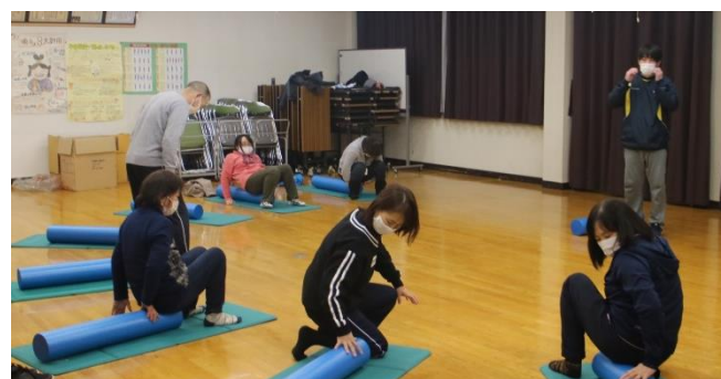
ストレッチ教室の様子