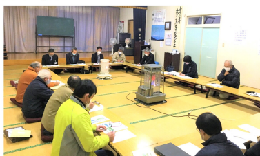
検討委員会の様子

10月24日(土)に実施した第1回検討委員会から12月5日(土)に実施した第3回検討委員会まで、計3回の検討委員会を実施し、報告書を作成しました。