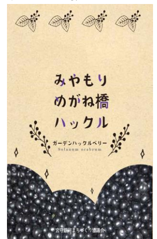
パンフレット(参考)