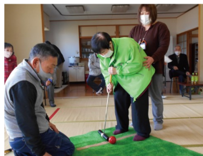
スカットボールで健康づくり