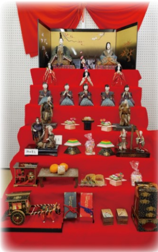
町婦協ギャラリー 7段ひな人形

ギャラリーでの展示は、大きなみずき数多くの吊るしびなをつるし、また珍しいひな人形なども展示しました。