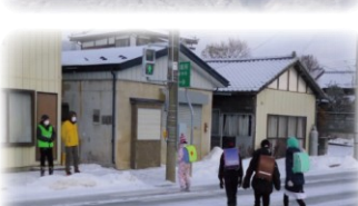
遠野つ子サポーター作戦 朝のあいさつ運動の様子