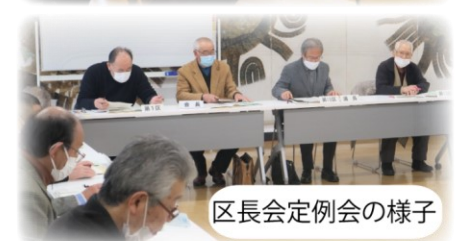
区長会定例会の様子