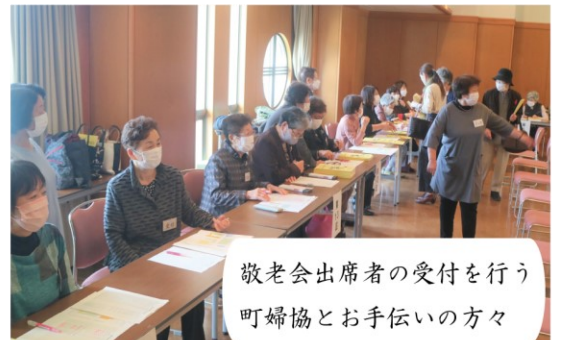
敬老会出席者の受付を行う 町婦協とお手伝いの方々