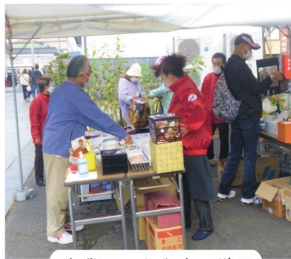
産業まつり出店の様子

12月に開催される歳末助け合い演芸会でも、フリーマーケットを出店予定ですので、その際にはぜひ、お立ちよりください。