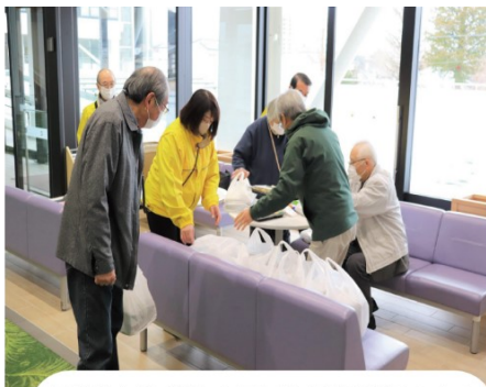
お弁当を仕分けする民生児童委員の方々