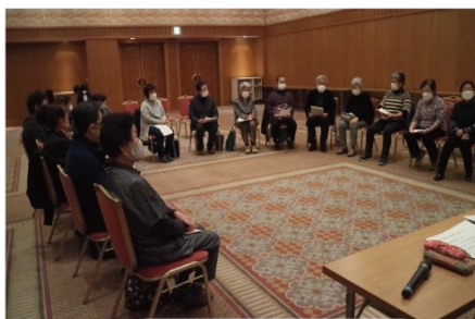
「市長と語る会」の様子

語る会の中では、大工町の歩道の整備や、除雪に関する事など、多くの意見・要望が出されましたが、市長からは対処策など、具体的なお話をいただき、1時間半に及ぶ熱心な意見交換は、たいへん貴重な機会となりました。