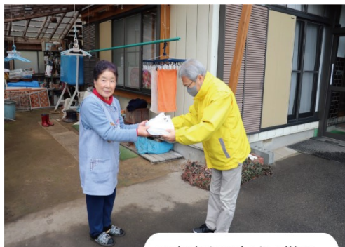
お弁当を配布する様子

毎年、この時期に開催されているふれあいホーム遠野の「お楽しみ会」は、新型コロナウイルス感染拡大防止のため今年度も中止となりましたが、12月6日（火）と7日（水）の2日間、民生児童委員、町内の福祉団体の皆さんの協力のもと、ふれあいホーム遠野の会員74名の皆さんに、お弁当が届けられました。