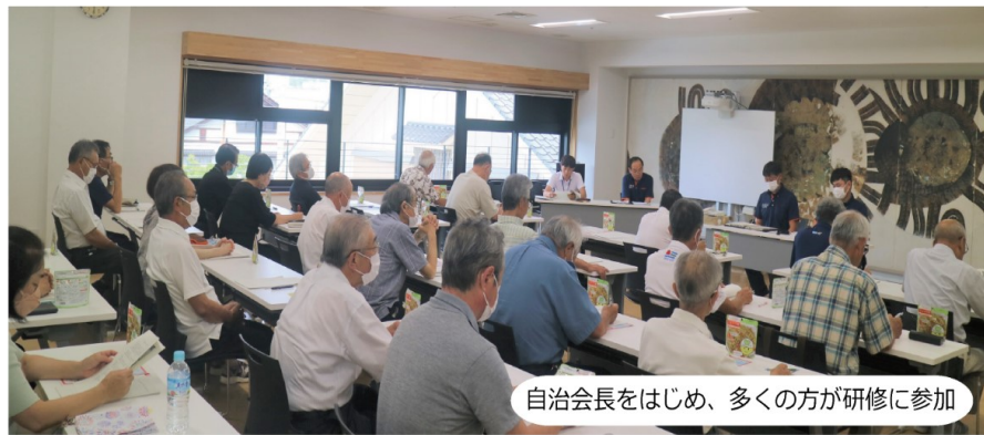
自治会長をはじめ、多くの方が研修に参加