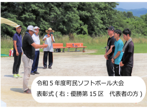
令和5年度町民ソフトボール大会 表彰式(右:優勝第15区 代表者の方)

決勝戦は、第13区と第15区で行われ、両チームとも1点を争う好ゲームとなりましたが、3回裏の第15区の攻撃では、3点を取りリードし、その後も得点を重ね、6対3で、見事第15区が優勝しました。なお、第15区は、遠野町の代表として、8月21日(月)から25日(金)まで開催される、遠野市内各町対抗ナイターソフトボール大会に出場します。