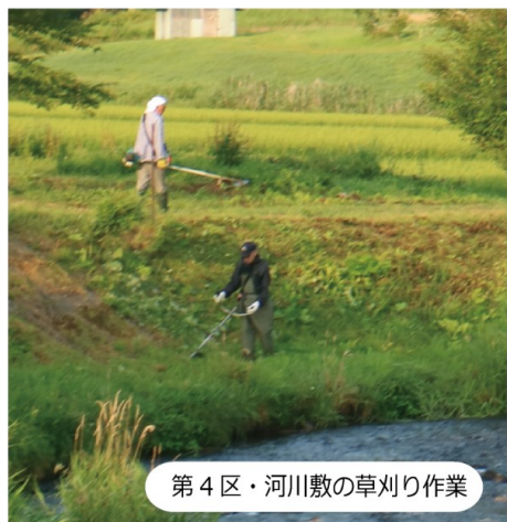
第4区・河川敷の草刈り作業