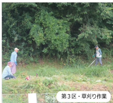
第3区・草刈り作業