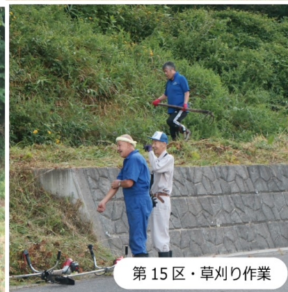
第15区・草刈り作業

毎年恒例の、町内一斉河川清掃が8月6日（日）、早朝から行われました。各自治会ごとに、早瀬川、来内川、猿ヶ石川の河川敷の草刈りを中心に、町内のゴミ拾いや草取りなども行われました。また、今回は6月に実施予定だった、遠野中学校クリーン作戦が中止になったことから、遠野中学校の生徒も大勢参加し、2時間ほどの作業で、河川敷・町内のゴミや草が綺麗に取り除けられました。