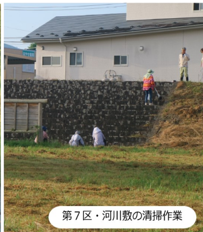
第7区・河川敷の清掃作業