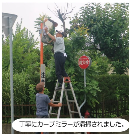
丁寧にカーブミラーが清掃されました。

8月20日（日）、交通安全協会遠野分会20名により、早朝6時から町内のカーブミラー清掃が行われました。 清掃は、5班に分かれて行われ、カーブミラーの鏡面の拭き取りや蜘蛛の巣の除去など、車両が安全に通行出来るように丁寧に清掃されました。また、清掃作業時には、補修が必要なカーブミラーの確認を行い、柱の劣化や鏡面に破損があり見えにくくなっているものがありましたので、修繕箇所をまとめ遠野市役所へ修繕の要望を提出します。