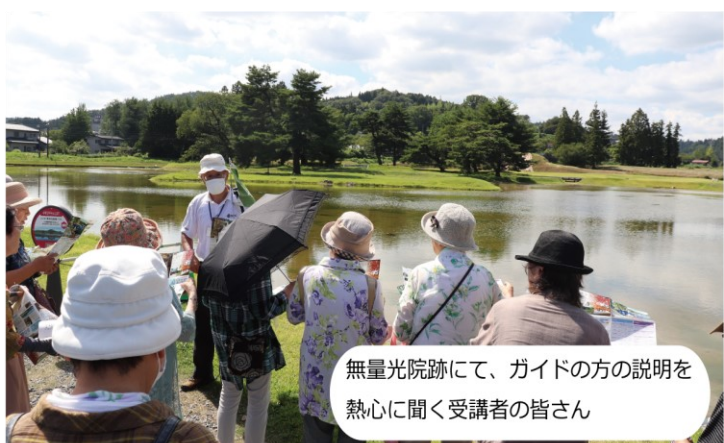
無量光院跡にて、ガイドの方の説明を熱心に聞く受講者の皆さん