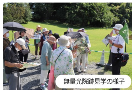
無量光院跡見学の様子