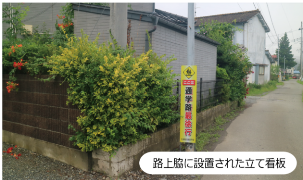
路上脇に設置された立て看板