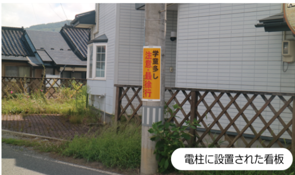
電柱に設置された看板