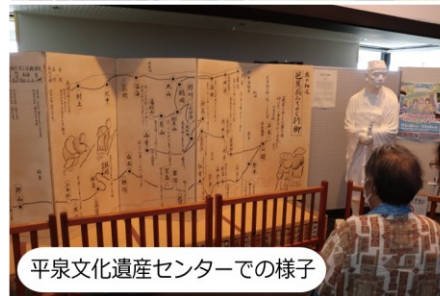
平泉文化遺産センターでの様子