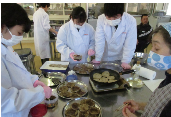
昨年12月、エゴマパウダーを使った「かねなり」に挑戦！

令和2年度は、遠野緑峰高校生と連携し、栽培から調理まで取り組みました。これまで記録したデータを生かし、生産性や新たなエゴマの商品研究など、今後の生徒の皆さんの取り組みに期待を寄せています。