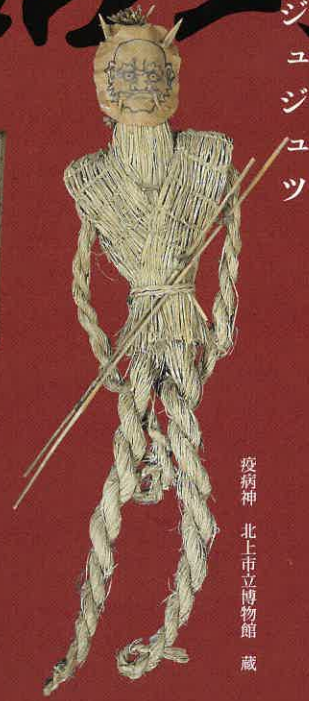
疫病神 北上市立博物館 蔵