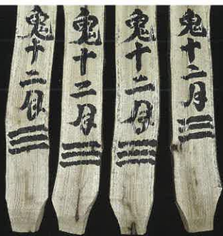
オニノハ 北上市立鬼の館 蔵

会場 ● 遠野市立博物館 企画展示室 入館料 ● 個人 / 一般310円 高校生以下160円 団体 / 一般260円 高校生以下110円 (20名以上) 開館時間 ● 午前9時～午後5時 (入館受付は午後4時30分まで) 休館日 ● 7月31日(月)、8月31日(木)