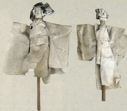
雪隠糞 えさし郷土文化館 蔵