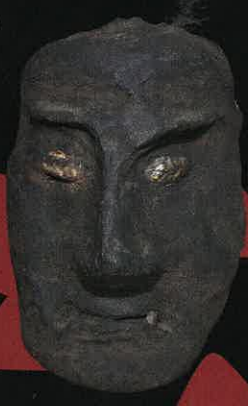
カマガミ 岩手県立博物館 蔵