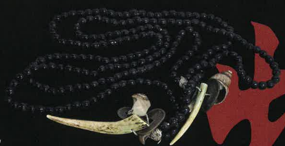
さとのりぬ珠 個人蔵