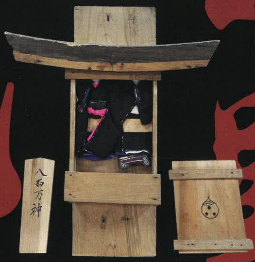
家の守り神(大工人形) 館蔵