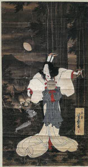
丑満丑の刻参り図 常光寺 蔵

「呪術」とは、 神や精霊などの超自然的な力や 神秘的な力に働きかけ、 種々の願望をかなえようとする行為、 およびそれに関連する信仰の体系のことを指すことばで、 「まじない」「魔術」などとも呼ばれます。 「遠野物語」には 様々なまじないの話が掲載されており、 遠野の民間信仰や年中行事などにも まじないの習俗を見ることが出来ます。 本展覧会では、遠野と岩手県内の まじないに関する資料を中心に展示します。