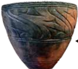
◀鉢形土器 枋洞遺跡 縄文晩期 約3千年前