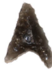
◀黒曜石製矢じり 枋内野崎遺跡 縄文後期 約4千年前