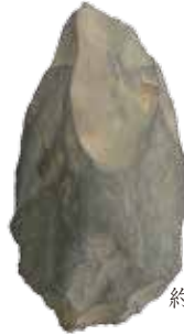
◀斧形石器 金取遺跡 前期旧石器 約3.5~6.8万年前