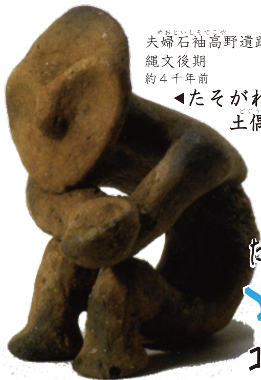
夫婦石袖高野遺跡 縄文後期 約4千年前 ◀たそがれ土偶