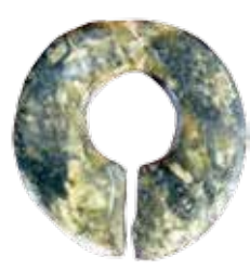
◀石製耳飾り 綾織新田遺跡 縄文前期 約6千年前

遠野市文化課 TEL: 0198-62-2340 MAIL: bunka@city.tono.iwate.jp