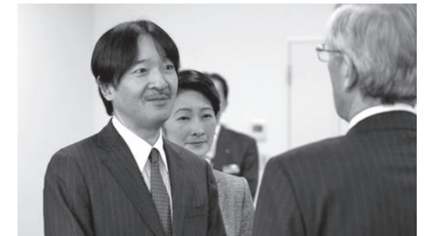
市民と懇談される秋篠宮同妃両殿下