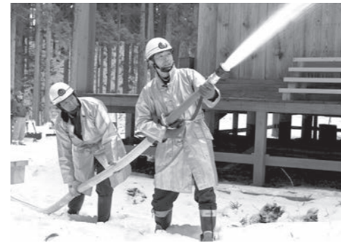
消火訓練に励む消防団員

1月26日の文化財防火デーに伴う消防訓練は1月20日、県指定文化財の鞍迫観音堂周辺(宮守町鱒沢)で行われました。参加した遠野消防署員や消防団員、地域住民ら50人は、初期消火や放水訓練などを通じ、文化財保護の意識を高めました。