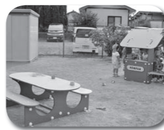
スウェア ジャパン SWEA JAPAN様 (東京都)