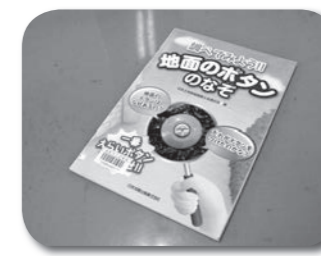
岩手県土地家屋調査士会様(盛岡市)