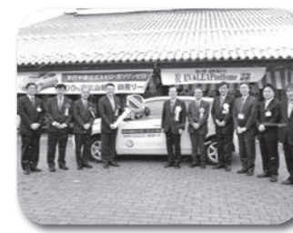
日産自動車(株)様 (神奈川県)