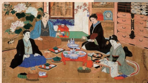
供養絵額 常楽寺(遠野市) 蔵