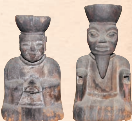
十王像 光明寺(遠野市) 蔵