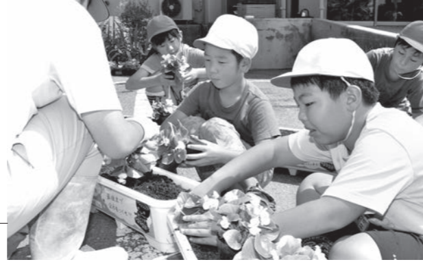
活動に取り組む遠野北小の児童ら