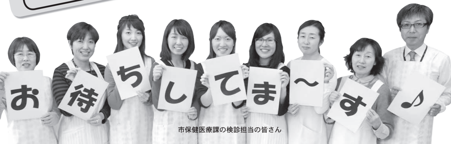
市保健医療課の検診担当の皆さん