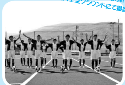
プロモーション動画第1弾！ (人芝グラウンドにて撮影) ↓

▶問い合わせ 希望郷いわて国体遠野市実行委員会事務局 (☎62-4413内線202)