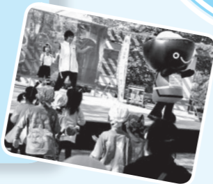
各種イベントでバツフルに わんこダンスを披露!!