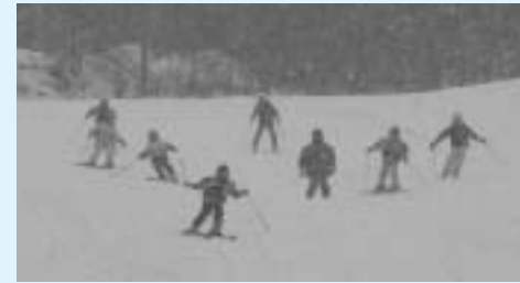
12月10日に行われた安全祈願式の後、初滑りを楽しむ赤羽根スキースポーツ少年団の団員たち