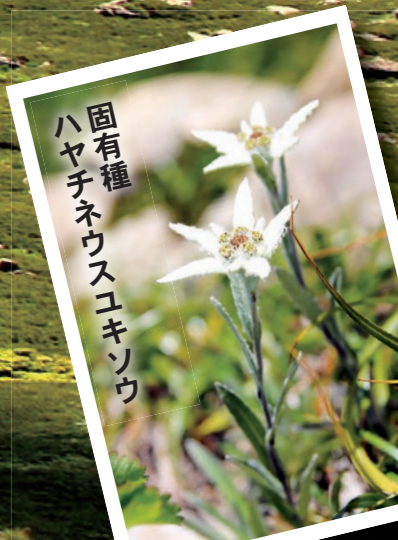
固有種 ハヤチネウスユキソウ

野三山の一つである早池峰山。日本百名山にも数えられ、高山植物の宝庫として全国的にも有名です。山開き当日は、早池峰岳神楽の奉納などのイベントを開催。登頂者には記念絵馬が配られます。