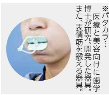
※パタカラ：医療と美容向けに歯学博士が研究開発した器具。また、表情筋を鍛える器具。

答 懇談を重ねる。宮守町区長会定例会での相対的な意見は、おおむね「良」であった。公平かつ公正に手続きを進めていく。