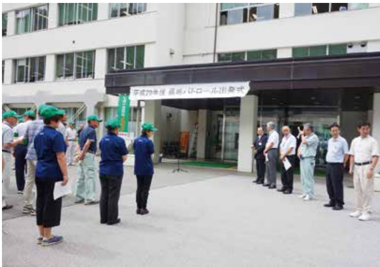
農地パトロール出発式の様子