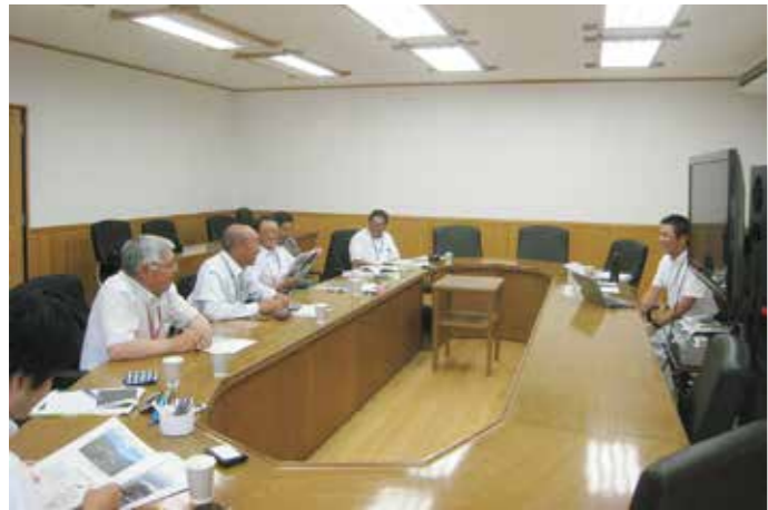
西栗倉村役場にてローカルベンチャー発祥の地といわれる取り組みを学ぶ

域マネージャー事業の活用をきっかけに「第一次産業を元気にすれば地域が再生する」と、林業再生を模索し始めた。議論の末、平成17年村の理念「心産業の創出」というテーマが生まれる。これは、物をたくさん作って売って終わりと産業界ではなく、互いに信頼し合える豊かな関係性を、産業を通して作り出していきたい。そういった地域経済を再構築したいというもの。