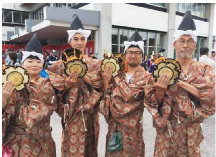
遠野まつりに参加する地域おこし協力隊員