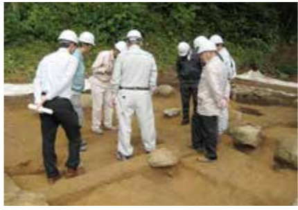
ハセ小屋の解体調査

ついていたことや、山際に移動したことがわかったとのことであった。解体された外にあった「便所」は、昭和49年主屋に水洗トイレが作られるまで使用していたとのことである。客用と家族用の便所が同じ屋根の下に別々にあった。その当時は客の出入りも多かったことが伺われた。