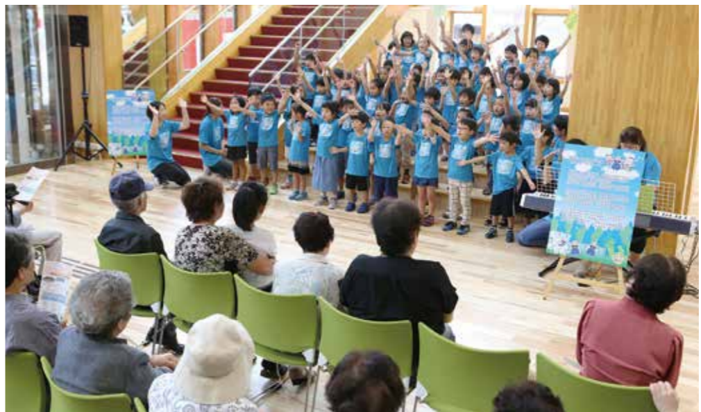
市役所内覧会でわらすっこの歌を元気に歌う子どもたち