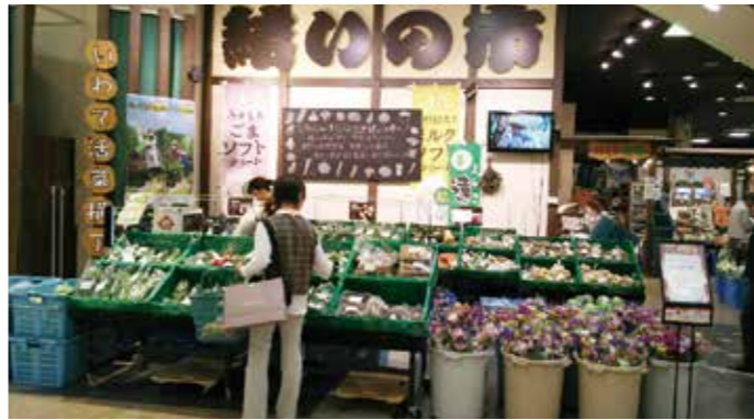
結の市(イオン盛岡南店)