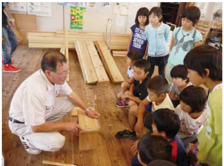
さまざまな工夫で小規模校のメリットを最大限生かし、デメリットを少しでも少なくするよう努力している

て、制約が生じることのほか、PTA活動等においては、保護者一人当たりの負担が大きくなることなどが挙げられる。