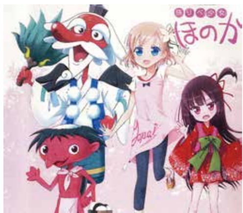
オリジナルアニメの波及効果を生み出していく事が大事