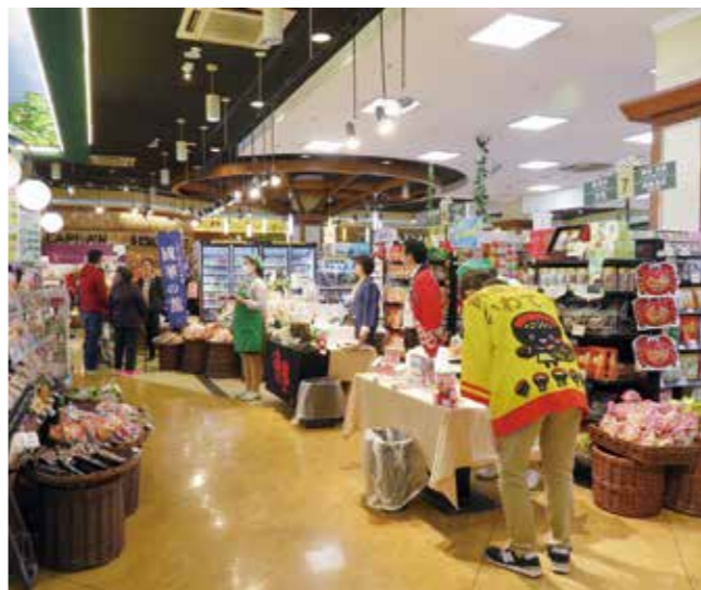
台湾での「遠野物産展」の様子