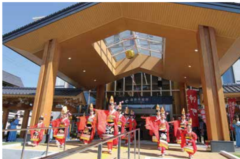
開庁式のオープニングを飾った地元仲町南部ばやし

行政文書係は、市議会に提出する議案の調整や条例規則等例規審査、情報公開・個人情報保護などに関する役割があり、行政運営上最も基本的かつ、重要なもので責任は重い。