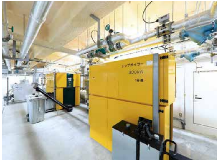
市役所本庁舎地下のチップボイラー