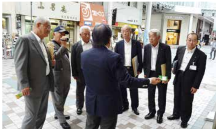
丸亀商店街で理事長から説明を受ける

400年以上の歴史ある商店街。再開発による整備では、広場、飲食店、時代に合った店舗、医療福祉施設と、区域によつて施設を分類。上層階の居住空間には高