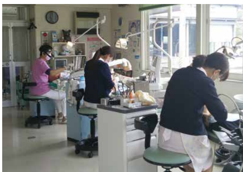
長い間地域医療を支える宮守歯科診療所 子どもから高齢者まで多くの方が利用している