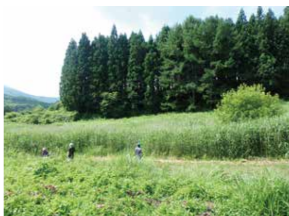
農地パトロールの様子