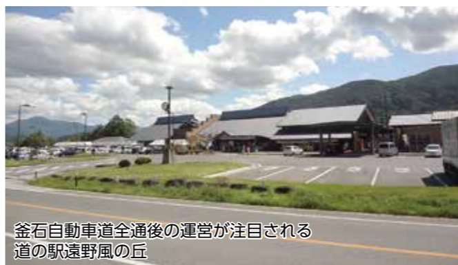
釜石自動車道全通後の運営が注目される道の駅遠野風の丘