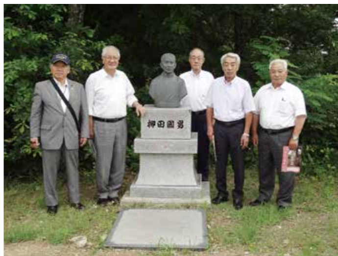
学問成就の道の柳田國男像