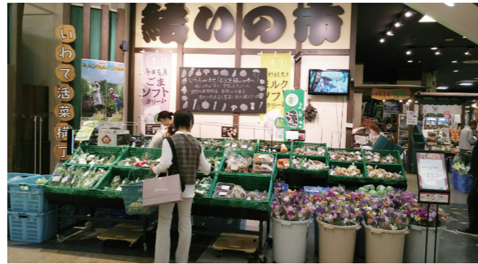
結の市 (イオン盛岡南店)