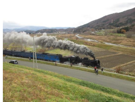
遠野風の丘デッキから SL 銀河見学