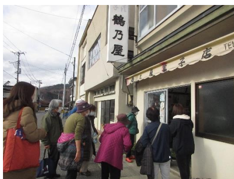
ガイド付きのまちぶら