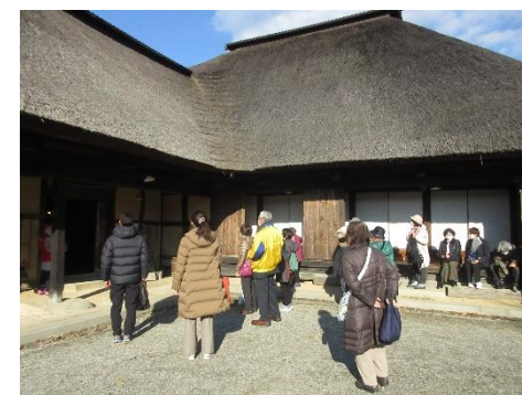
遠野ふるさと村の曲り家見学