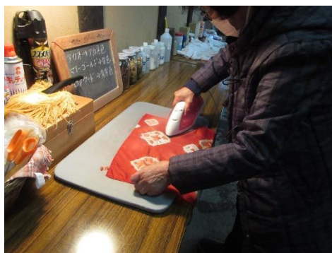
遠野ふるさと村でのハンカチ染め体験