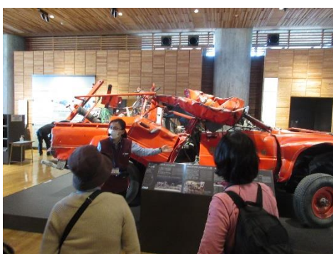
いわて TSUNAMI メモリアルでのガイド解説