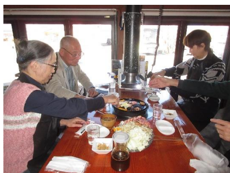
食肉センター（遠野名物ジンギスカン）