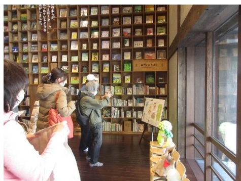
こども本の森遠野見学