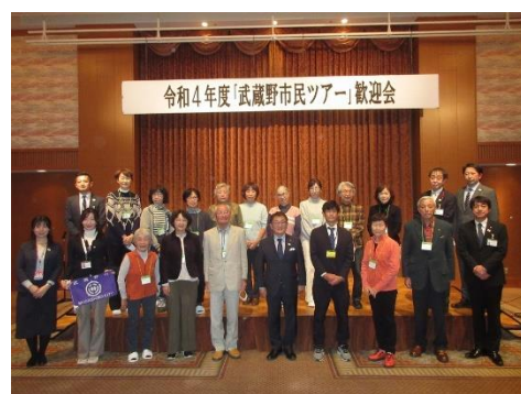
あえりあ遠野での歓迎会