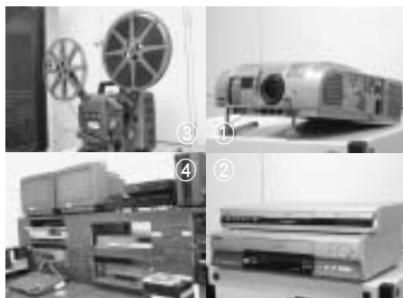
①プロジェクター ②ビデオ・DVD再生機 ③16mm映写機 ④編集室

視聴覚ライブラリーでは、誰もが気軽に映画館と同じ雰囲気を楽しめるように、月に一度16mm映写機を使用して「子ども映画会」などを開催しています。