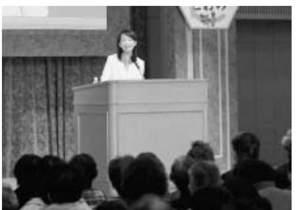
水の大切さを実体験をもとに講演するアグネス・チャンさん