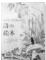
「ワイズ・ブラウンの詩の絵本」マーガレット・ワイズ・ブラウン 著

世界中で、いつの時代も読み継がれてきた絵本作家の一人であるワイズ・ブラウンの詩集です。子ども身の身近にあるものを題材にした親しみやすい絵本です。