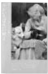
「今がいちばんいい時よ」ターシャ・テューダー 著