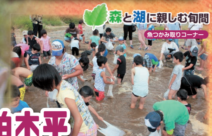
森と湖に親しむ旬間 魚つかみ取りコーナー