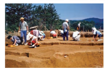
昭和60～61年に行われた発掘調査の様子

人類は約700万年前にアフリカで誕生した。彼らは何百万年もかかってそこから出て世界中に広がっていった。そうして日本列島に到達した。その彼らはま