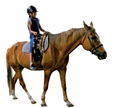
4_馬の里ではポニーとのふれあいや乗馬を 体験 5_土淵小児童とゲームを通じて楽し く交流する福崎町の子どもたち