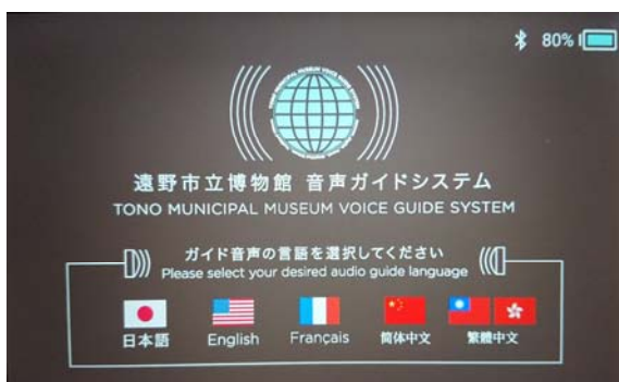
タブレット・言語選択画面