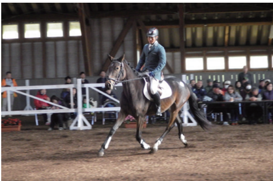
本州唯一の乗用馬市場の様子

また、馬の里の職員が不足していると聞いているが、馬事振興をすすめていくうえで、馬の里は重要な役割を持っている。特別な技術が必要と思うが養成して不足のないように臨んでほしいが。