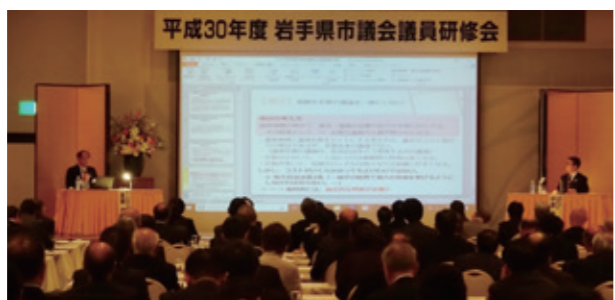
北上市議会の事例発表の様子