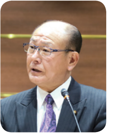
佐々木 敦緒 議員