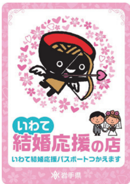
遠野を挙式や披露宴会場に選んでいただける取り組みを