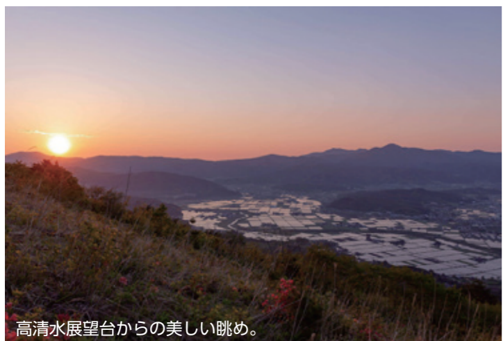
高清水展望台からの美しい眺め。