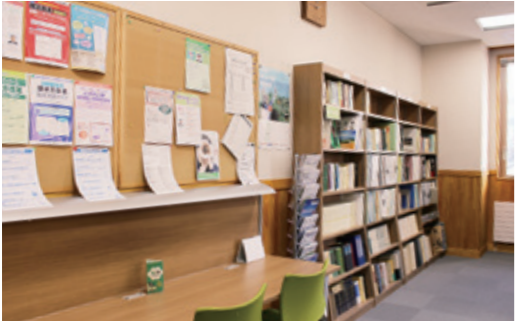
議会図書室もあります

市民の代表として会議に参加しているので、市民の意見を代弁する責務があります。個人の意見だけではなく、市民としての意見を広く述べることが出来るよう、普段からさまざまな地域での活動に参加したり、市外の人と交流したり、対話や情報収集をしています。