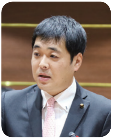
小松 正真 議員