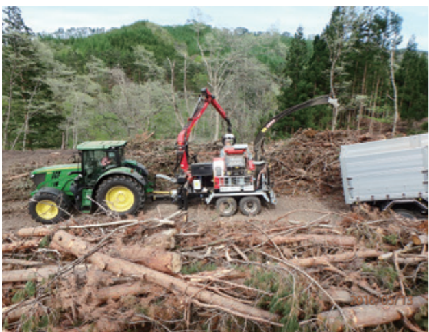
トラクターを動力源とする移動式チップパーは、林地の間伐材や支障木を現地でチップ化する。