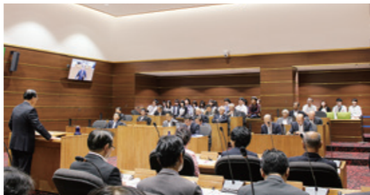
一般質問を傍聴する大学生のみなさん