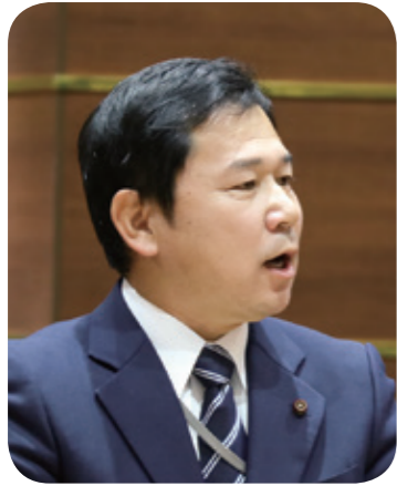
菊池 美也 議員

「遠野市景観資源の保全と再生可能エネルギーの活用との調和に関する条例」平成27年4月1日施行 再生可能エネルギーに関する事業を推進しつつ、永遠の日本のふるさと遠野として守り続けてきた景観資源を保全し、将来の世代に継承することを目的とする。