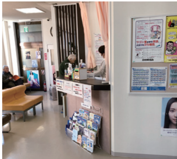
早いうちに受診しようかな