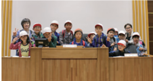
議長席でパチリ。達曽部小学校のみなさん