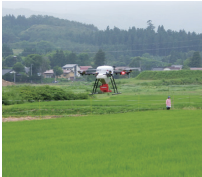
普及しつつあるドローンによる薬剤散布

答 遠野普及サブセンターによると少ない。いもち病については、天候に恵まれたこともあるが、共同防除の効果が大い。カメムシ