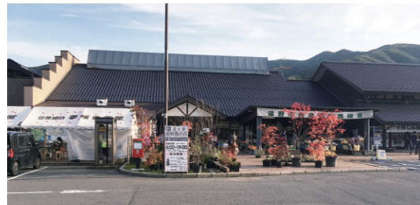
収支の改善には現場の声が必要