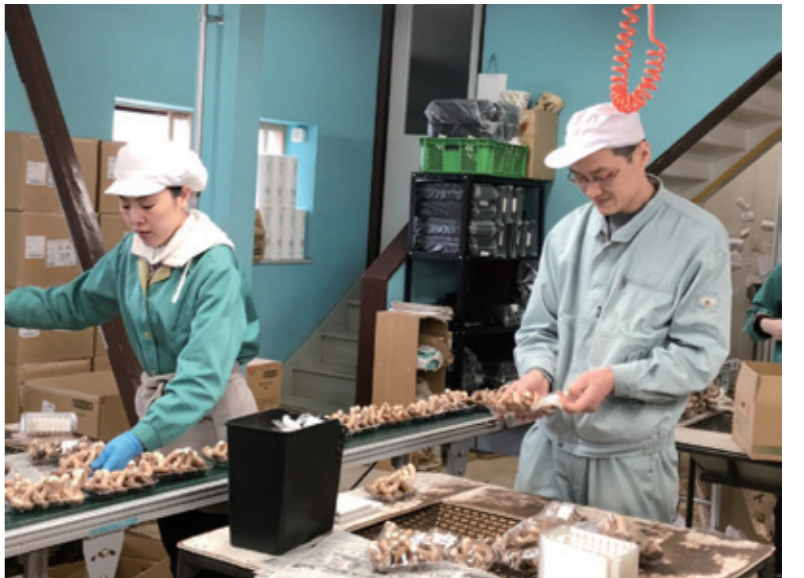
市内の企業で働く外国人技能実習生

答 受入事業所には技能実習指導員・生活指導員の配置が義務づけられており、実習生の教育・相談をそれぞれが受け持つこととなっている。国の法律に基づいた