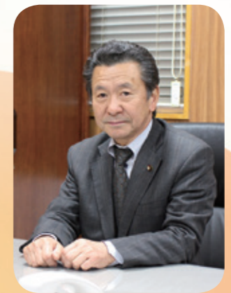
遠野市議会議長 浅沼 幸雄

「政務活動費」は、議員の調査研究、研修や市政の課題及び市民の意思を把握し、市政に反映させる活動に充てられますが、交付額を超過して支出した場合は自己負担となります。なお、残額81,392円については、遠野市の歳入に返還しました。