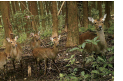
ニホンジカの群れ