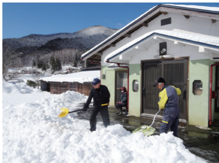
高齢者宅の除雪応援