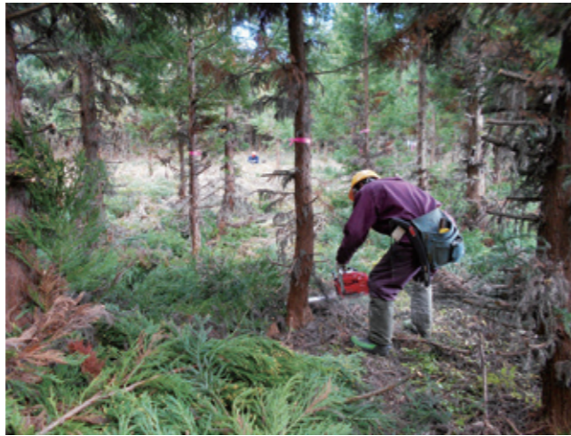
除間伐作業が進み健全な森林へ

伐などが必要であるため、人材の育成に取り組んでいる。平成31年度から始まる※森林経営管理制度で、森林経営の担い手確保を図っていく。今植林しなければ将来、林業が生業として成り立たなくなると認識している。