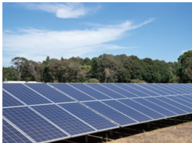
遠野の自然景観と調和することが大前提の再生可能エネルギー事業のあり方は…