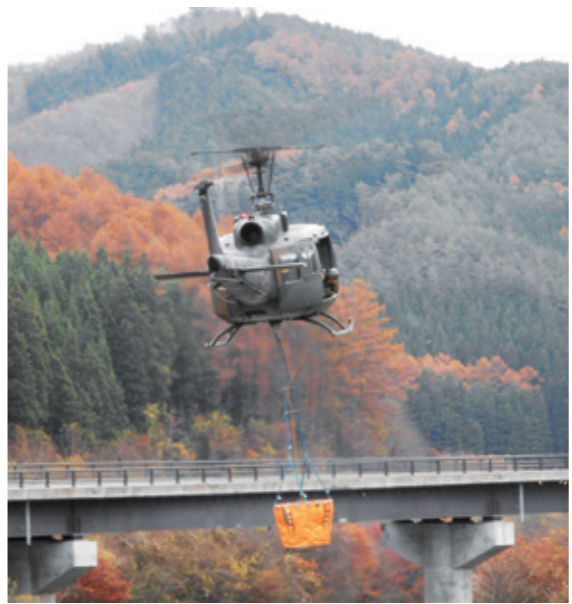
みちのくアラート 2018 で山林火災消火訓練の様子

災害時における情報伝達基幹システムである、防災行政無線のデジタル化整備の進捗状況は。