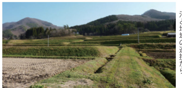
景観保全は小規模農家の汗と地域の連携から…

個人農業者については、高齢者でも作業が容易なピーマン、アスパラガス、ニラなどの軽量作物を推奨し、所得の確保を推進してきた。今後においても、小規模と大規模の棲み分けを明確にしなが