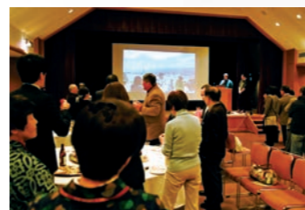
さまざまな人が参加した交流会

1月に、「遠野文化まちづくりネットワーク交流会『遠野物語』☆超会議 - 発刊110年へキックオフ!」という集まりがあった。「いったい何をやる集まりなの??」という声をいくつか聞いたが、それほど難しいものではない。来年の発刊110年をきっかけに、これまで以上にすてきな遠野をつくっていきましょうという集まりなのだ。だが、主催が当文化研究センターだったこともあって、誘った人の何人かは「文化的集まりは、私は場違い感いっぱいだから～」と参加を見送った。いくつかの誤解があって、そういう選択をさせてしまったようだ。