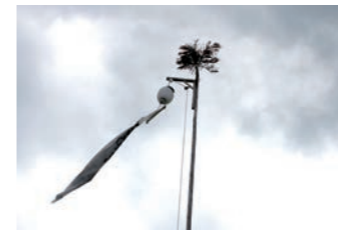
設置されたムカイトロゲ

お盆に帰省し、お墓詣りに行った。掃除をしようと墓石の上から水をかけたところで小学生の姪に、上からかけたら駄目、と注意をされた。下からかけて、最終的に上にかけるのだと言う。私は聞いたことがなかったので尋ねてみると、とあるテレビで見たいらしい。おそらくどこかの風習なのだろう。