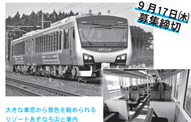
大きな車窓から景色を眺められるリゾートあすなる④と車内