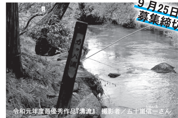
令和元年度最優秀作品「清流」

環境フロンティア遠野が開催する写真コンテストに、あなたが大好きな遠野の写真を応募ください。