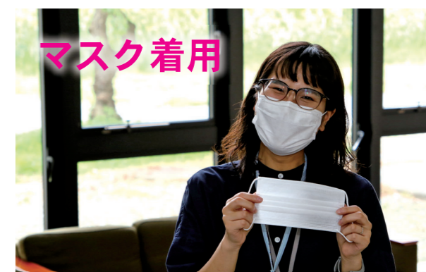
症状がなくてもマスクを着けましょう。鼻と口の両方を確実に覆いましょう。

■新しい生活様式の実践例▷3密(密集、密接、密閉)を避ける▷毎朝体温を測定し、健康をチェック▷誰とどこで会ったのかなど、行動をメモする▷料理は大皿を避けて個々に▷持ち帰りや出前を活用—など