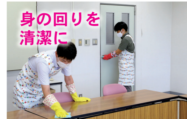
職場や店舗、家庭などで、身近な物を消毒して感染を防ぎましょう。 [厚労省 コロナ消毒] [検索]