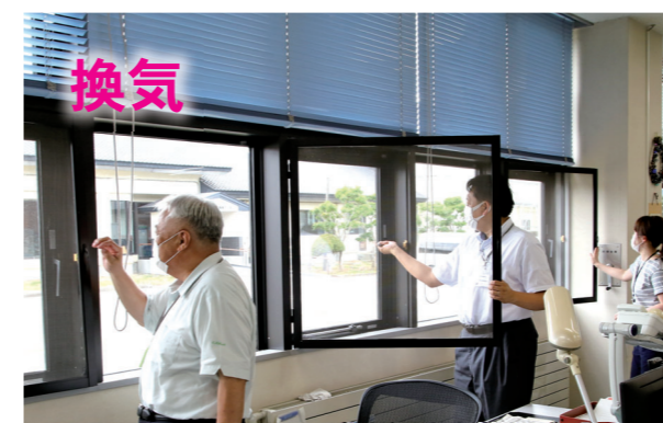
職場や自宅などでは30分に1回、5分程の換気をしましょう。エアコンは換気になりません。