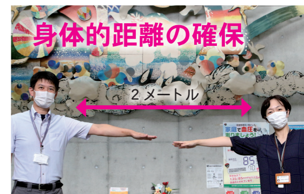
人との間隔は、できるだけ2メートル(最低でも1メートル)空けましょう。