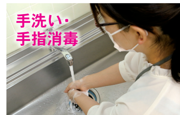
こまめに手洗い・消毒をしましょう。帰宅後は手や顔を洗い、シャワーを浴びるのも効果的。