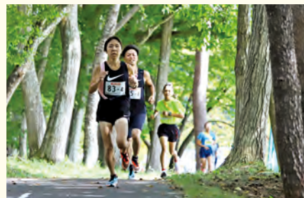
たすきをつないで周回コースを駆け抜ける選手

リレーマラソン(遠野市陸上競技協会主催)は遠野運動公園で初開催され、市内児童生徒や県内陸上愛好家ら約150人がたすきをつなぎました。同マラソンは、コロナ禍で大会の中止が相次ぐ状況を受け、「仲間やライバルと走る環境づくり」や「走る楽しさ・喜び」を感じてもらおうと同陸協が企画。感染症対策を行いながら、市民の努力と工夫で大会は行われました。