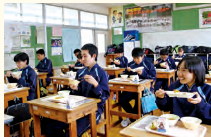
亜麻豚が使われた給食を食べる遠野西中生徒

北日本J A畜産(附馬牛町)が児童生徒のために遠野産亜麻豚約2000人分を無償提供し、給食として市内全小中学校に届けられました。健康食品としても注目される亜麻仁油やエゴマなどを配合した飼料が与えられた亜麻豚は、良質な脂身とうま味が特徴。提供は、コロナ禍で低迷する市内企業や地場製品のPR・消費拡大につながればとの願いが込められています。