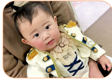
龍星さんのお子さん