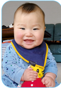
達也さんのお子さん