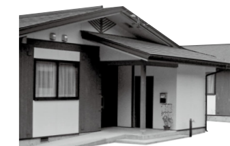
写真_宮守町にある吉金団地