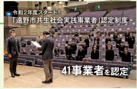
令和2年度スタート! 「遠野市共生社会実践事業者」認定制度