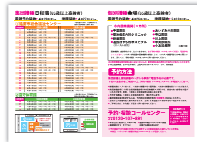
裏面/接種日時・会場や予約方法など