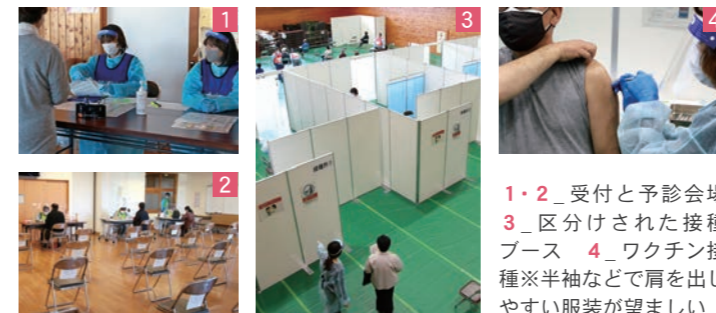
1・2_受付と予診会場 3_分けされた接種ブース 4_ワクチン接種※半袖などで肩を出しやすい服装が望ましい

市は4月27日、市内65歳以上の高齢者(約1万人)を対象とした「集団接種」を、遠野市総合福祉センターで開始しました。当日は、予約者90人が米国・ファイザー社のワクチンを接種。県立遠野病院および遠野市医師会の医師、看護師をはじめ、市消防本部の救急隊員や市保健師ら約20人体制で接種を行いました。市内9医療機関などでの「個別接種」は、5月10日(月)より開始予定です。