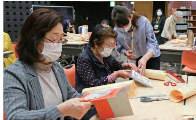
手作業で本にカバーを付ける参加者