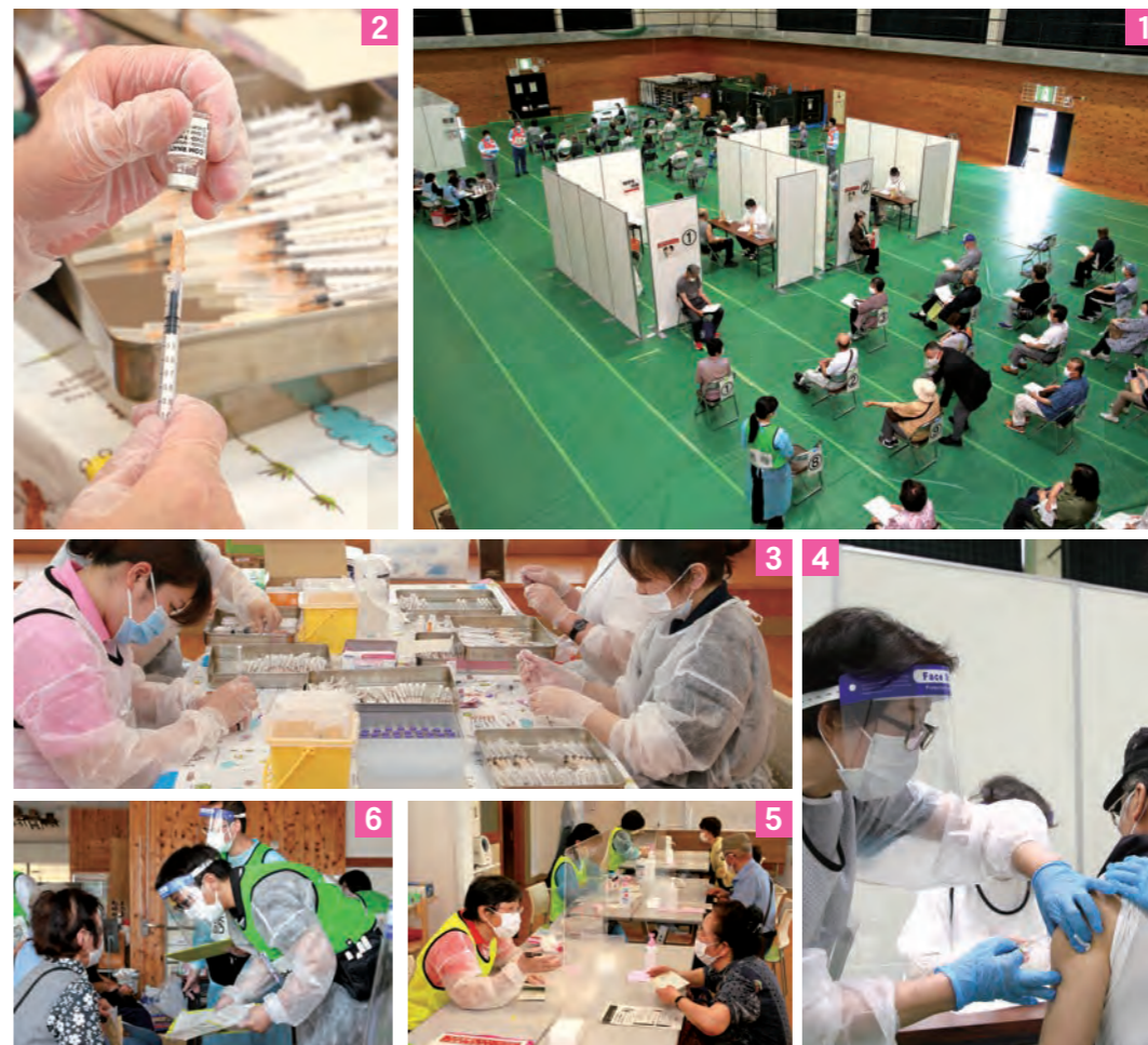
1_ 集団接種会場 2・3_ ワクチンの希釈・注射器充てんをする看護師と薬剤師さん 4・5・6_ 県立遠野病院、遠野市医師会、花巻市薬剤師会遠野支部などさまざまな関係者と市民の協力のもとで運営される接種会場

予約は大変だったけど、会場で関係者の姿を見て、守られていると感じホッとしました。“80代女性”