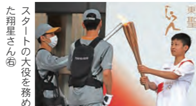
スタートの大役を務めた翔星さん(左)