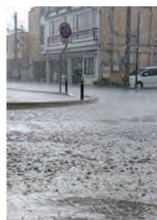
【写真】記録的降雨で一変した街(とびあ付近)

発生した1時間降水量33.0mmの雨は、6月の観測史上最大でした【写真】。 災害はいつ起こるか分かりません。レベル1・2で各メディアの気象情報を確認して避難に備え、自治体が発令するレベル3～5の情報に基づき、命を守る行動を取るようにしましょう。災害時の避難方法や非常用持ち出し物品などについては、防災マップや本紙4月号などでも紹介しています。