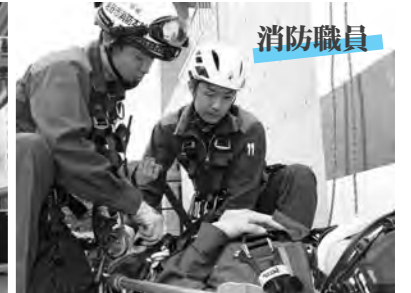
【写真】一般・土木/令和3年度採用職員 消防/令和2年度採用職員