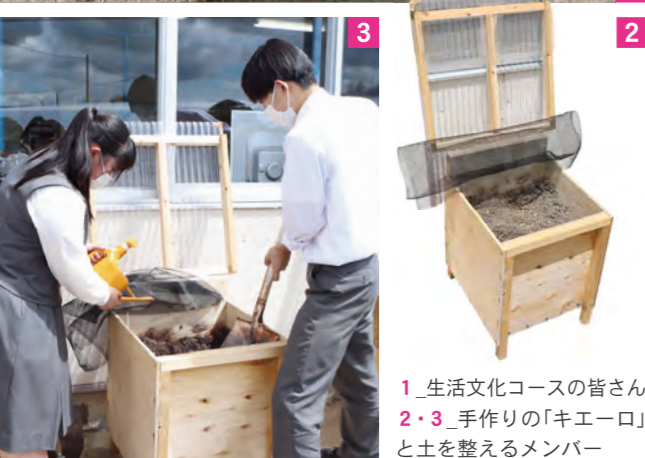
1_生活文化コースの皆さん 2・3_手作りの「キエーロ」と土を整えるメンバー