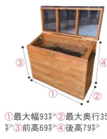
①最大幅93センチ②最大奥行35センチ③前高69センチ④後高79センチ

【キエー口とは】…微生物の力で生ごみが消失する木製のコンポスト。虫や臭いの発生を抑制し、従来のコンポストより衛生的で優位性が確認されています。市ではキエー口の普及を進めています。