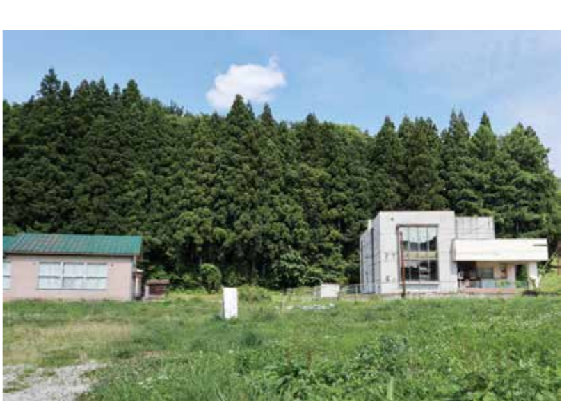
完成が待たれる鱒沢地区センター予定地