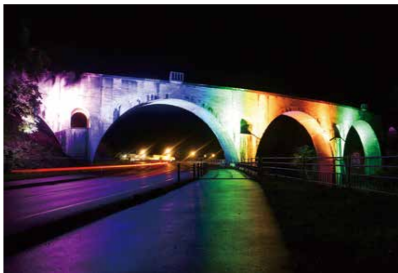
日本夜景遺産に認定されためがね橋（宮守川橋梁）

問 花火まつりの必要性は。 答 中止されていた2年間でふるさと納税の寄附が550万円ほどある。長く愛されてきた事業であり、コロナ収束の願いを込めて開催したいと思っている。 問 遠野まつり関連予算を増額すべきでは。 答 令和4年度に遠野まつり50周年を迎える。これまで特設ホームページを立ち上げるなど準備をしてきた。令和4年度は100以上