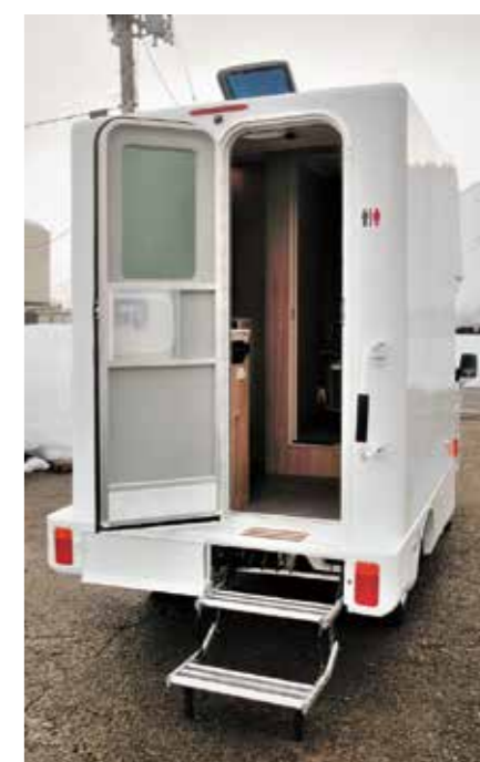
軽トラック自走タイプ

問 …………… 過去に、トイレの設置に関する議論があった。その内容は、有事や非常時のトイレトレーラーの備え、スポーツ大会開催等の早瀬河川ブランド、新たな観光誘客に向けて高清水展望台、荒川高原等へのトイレ設置の考えを