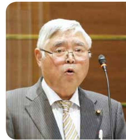
新田 勝見 議員