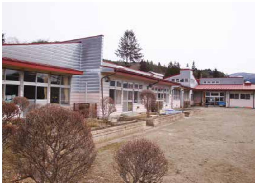
早期の改築が望まれる宮守保育園

担い手問題は重要である。林業で生計や事業が可能かを明確にするため、森林経営ビジョンに向けた座談会と林業版「起業塾」を開催し、そこに参加する人を増やす取り組みを始める。