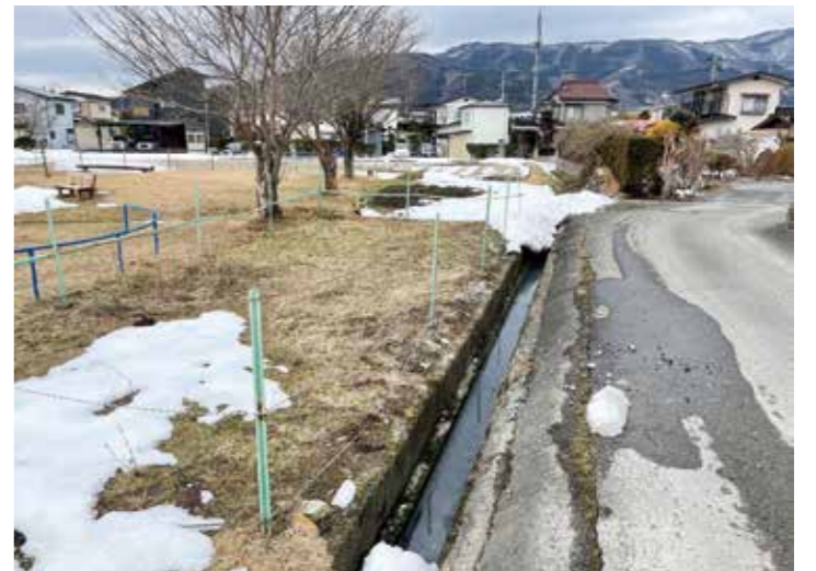
異臭など衛生面で早期の改良が望まれる水路の一例

問 ..... 今年寒波と積雪量で除雪も苦労したと思うが、次のシーズンに向けて早期の対策が必要では。