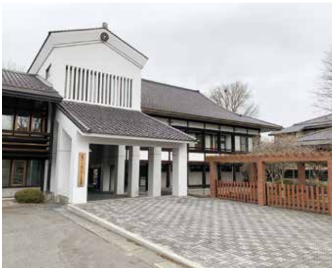
旧土淵中学校は次のステップに

答 (市長) ..... 土淵町の皆様に過度な負担は想定していません。市民の皆さまに多くの意見をいただいで、旧土淵中学校を明るく良い拠り所になるようにしていきたい。