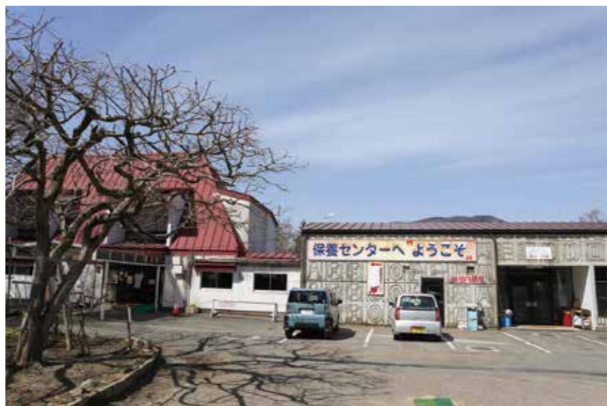
廃止された清養園保養センター

問 …………… 東日本大震災で、エネルギーの重要性を痛感した。市民の安心安全で快適に暮らせる環境は欠かせないものであるが、エネルギーの供給源の立場で市長の考えは。 答(市長) …………… 災害時の消防車両や緊急車両等に関して災害協定を締結し、燃料の確保を行っている。さらに、電力会社とも必要な電力を確保するような仕組みに繋がってきたい。遠野市としても、バイオマスなど再生エネルギーに力を入れていく。市内で発生する各種ゴミについても、資源化にできるものは調査していきたい。 問 …………… 遠野市新エネルギービジョンが策定され、多種のエネルギー導入により自立分散型エネルギー供給体制により安全・安心な住民生活