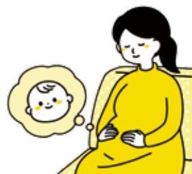
安心して出産できる環境を

問 ※ハイリスク妊産婦へ宿泊費助成の内容は。 答 これまでもハイリスク妊産婦の通院交通費を助成している。加えて、診察や分娩のため周産期医療センター