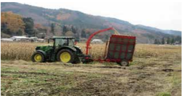
水田をデントコーンに転作大型機械作業に励む青年酪農家

答 (市長) 畜産業、遠野では中心的な農業、本政策によってエサが減る。土地改良区も成り立たなくなると考える。