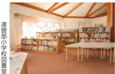
達曽部小学校図書室

問 …………… 平成27年4月から一部改正された学校図書館法の学校司書の法制化の認識と、これまでの当市の対応経過は。 答(教育長) …………… 努力義務として設置できると承知している。改正から7年が経過しているが、学校司書の配置基準は当市にはない。 問 …………… 司書教諭と学校司書の違いはどこにあるのか。 答(教育長) …………… 司書教諭は学校図書館の運営と指導を司る。学校司書は学校図書館の整備や案内などを担当する。現在市内小・中学校に17名の司書教諭が配置されている。 問 …………… 市総合教育会議の中