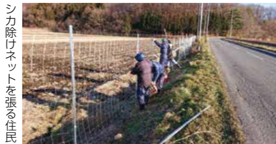
シカ除けネットを張る住民