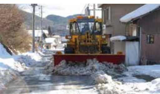
路面に凍結した圧雪のはぎ取りを頑張る除雪委託業者