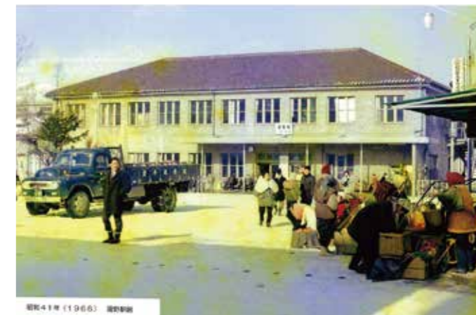
昭和41年の遠野駅前の様子

全協において、今までの遠野駅舎改築整備に係る関係団体説明会の結果報告があった。本来現駅舎の存続を求めてスタートしたものだだったが、その後JR側では、耐震などの安全面において難しいので規模縮小して改築したいとの考えだったと思う。今回A案からE案まで5つの案の資料が配布され、事業費数が10億円、大きなホテル必要か、大型入浴施設