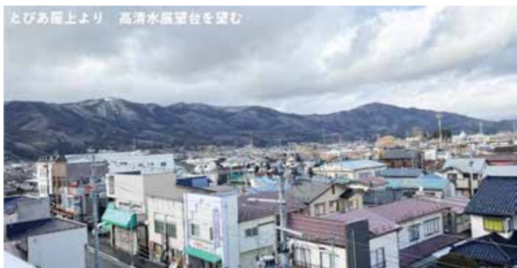
とびあろ上より 高清水風葉台を望む

問 …………… 高清水ソーラー建設の進捗状況は。 答(市長) …………… まだ何らかの形でアクションがないが、周辺下流に、土砂災害特別警戒指定区域が複数で、住居も多数あるので、この点はしっかりと見て指導しなければと考えている。防災や接続する水路等重要視しており、解決されな