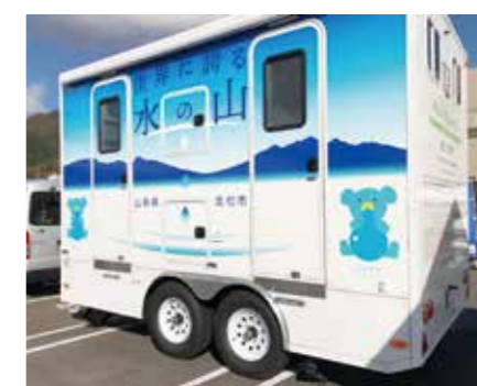
4つの個室トイレを持つ牽引タイプ