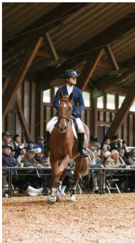
創意工夫してきた乗用馬市場 持続可能な馬事振興への取り組みを

問 遠野馬の里の施設が老朽化している。計画的な修繕を。 答 ふれあい事業に関わる箇所から優先して取り組んでいる。今後、馬の里と協議しながら優先修繕計画をつくり進めたい。 問 ホースパーク供用馬の高齢化対策は。