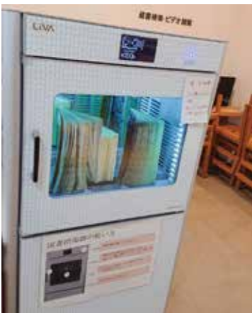
感染症対策として図書消毒機も設置されています。