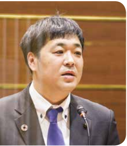
小松 正真 議員