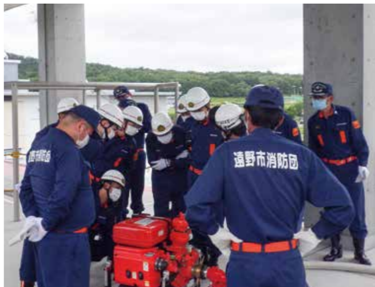
消防団機関運用訓練の様子

問 消防団員の定数を935名から850名に減らした理由は。 答 市の人口減少に伴い、消防団員も減少している。現状に併せて850名としたい。これからは、処遇改善をしながら団員を確保していく。 問 今回の報酬改正によって団員確保ができるのか。 答 今、20代が62名と少なく、これから企業