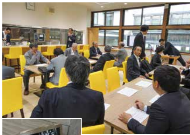
令和元年6月30日にオープンされた食育カフェ「スクオーラ カフェテリア アダージオ」