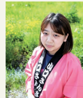
山口さんさ踊り保存会 踊り手

山口さんさは、大正4年頃に川井村小国から山口集落へお婿さんに来た大工さんの縁で伝わり、生まれたそうです。私は、保存会長も務めた亡き祖父や踊り手だった母と姉たちと一緒に過ごす中で、3歳から始めました。腕の位置や姿勢、表情、掛け声など厳しく教えられたこともありましたが、12種類ある踊りを覚えるのは大変でしたが、良かったよと言われるとやってきて良かったと実感します。代々受け継いできた笛と太鼓と踊り、全部が合わさったところをぜひ見て楽しんでほしいです。遠野まつりへの参加を楽しみにし、少しでも地元を盛り上げたいです。