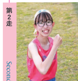
第2走 Second Runner