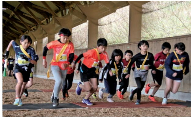
競馬のファンファーレとともにスタートする選手たち