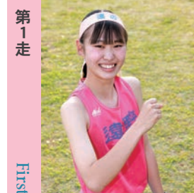
第1走 First Runner