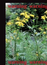
オオハンゴンソウ

2種類とも、繁殖力が非常に強い植物。根から他の植物を殺す酵素を出し、どんどん生息域を広げます。わずかに残った根から、何度でも再生します。種は何年も地中で死滅せず、土の掘り返しなどにより発芽します。見つけた場合は、駆除にご協力ください。