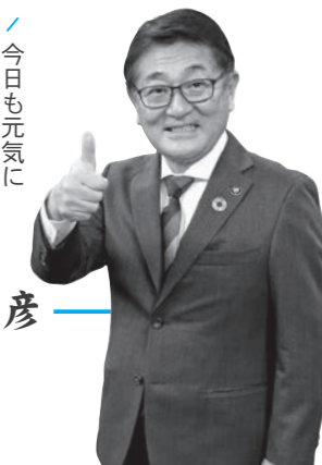
遠野市長 多田一彦