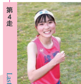
第4走 Last Runner

逆転されても前についていけと強く思って走りました。苦しかったときに、家族・仲間・地域の人の応援が力になりました。緊張も不安もありましたが、優勝できてうれしいし、ホッとしています。まだまだ自分は力不足。歩幅を伸ばす意識「5歩の努力」を日々の練習で大切にしたいです。