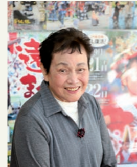
遠野市婦人団体協議会 会長