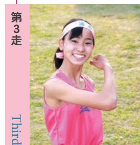
第3走 Third Runner

個人では11分50秒を切ることを目標にしていました。タスキを受けたときの先頭集団との差は25秒くらい。1位でタスキを渡し、差を広げられるように前半から突っ込んでいきました。調子もよく、かなりいい走りができたと思います。全中出場を目指し、これからも練習を頑張りたいです。