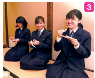
1_茶道部のみなさん 2_お点前を披露する部員 3_茶菓子を楽しむ部員