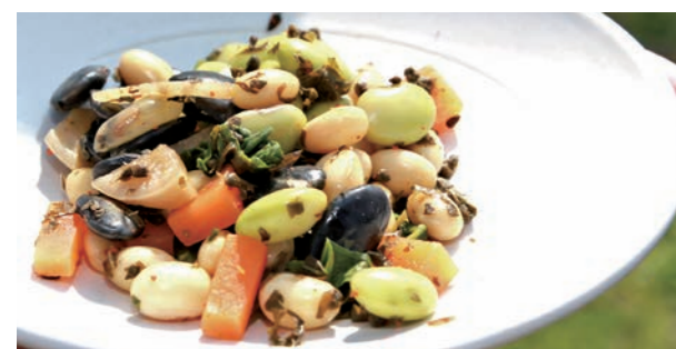
学生特別賞を受賞した「琴畑カブと3種の豆のしそ実漬け(エゴマ葉入り)」。同漬物は、緑峰祭などで試食会が行われる予定。