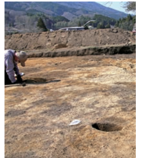
綾織町の住宅建設予定地で実施されている調査現場

なぜ発掘調査をするかというと、遺跡は地中にあるため、工事で掘削されると失われてしまいます。その前に、どんな遺跡であるか正確に記録するために、文字に残っていない歴史を明らかにすることができ、とくに縄文時代は文字が無いため、その時代の歴史を知るには発掘調査の手法のみでしか知ることができません。個人の土地の場合、面積は決して広くないものの、貴重な発見を秘めている場合もあります。調査が進んでいる綾織町の住宅建設予定地も新たな遠野市史の1ページとなる発見があるのか、期待が高まります。