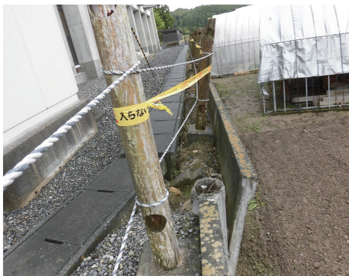
修繕予定の旧土淵中学校体育館脇の擁壁

問 工にミスはなかったか。 答 体育館脇の擁壁の修復工事。過去の設計・施工に間違いはないと判断し、前回同様の工事を行う予定。 問 風の丘改修工事の内容は。昨年の工事では見つけられなかったのか。 答 昨年11月から雨漏りが発生している箇所は修復工事。前回の改修では、対象にしなかった箇所であり、見つけられなかった。