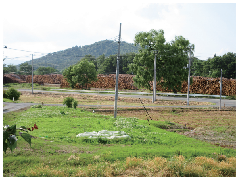
遠野の新たな林業振興木質バイオマス発電事業

問 これまで使われていなかった林地残材を活用する木質バイオマス発電事業所の整備に「ふるさと融資制度資金」を活用して民間事業者が貸し付けるもの。 答 市債によって無利子で貸し付けるもの、利子の75%が国から地方交付税措置される。