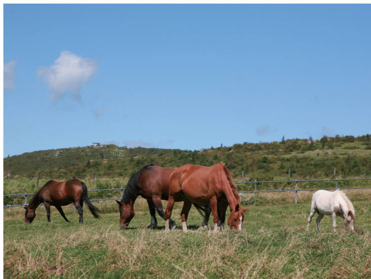
荒川高原に放牧されている馬

問 放牧管理システムを導入する目的は。 答 荒川高原と石羽根牧場の馬と牛に、ICTタグをつけ管理する。事前に位置が把握できるため、点呼や目視での確認作業の省力化になる。