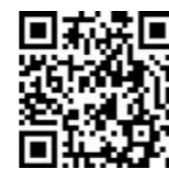
申し込みはコチラ

※13時の見学会をインターネットライブ配信の予定です ※新型コロナ対策のため内容を変更する場合があります