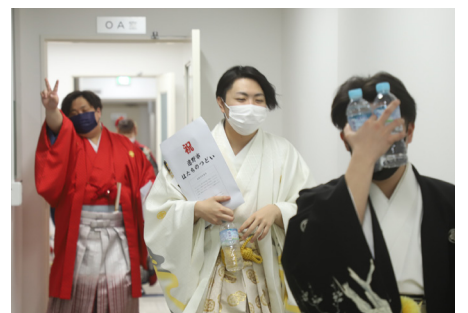
遠野市はたちのつどい 2023/1/8 おめでとうございます