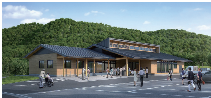
念願の鱒沢地区センターの完成予想図 令和6年4月使用開始予定

答(市長) …………… 主体で整備検討委員会を立ち上げ、令和元年8月に用地取得が完了。令和3年度人口減少時代に対応した施設にと、基本計画策定。翌4年度に実施計画と実施設計を行い合意形成を図った。