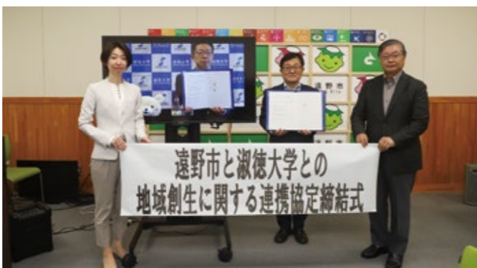
淑徳大学との連携協定締結