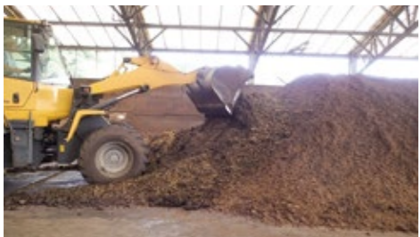
堆肥の担う役割これから大きくなる