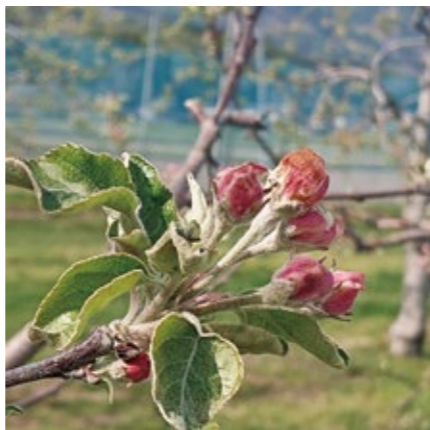
被害にあったリンゴの中心花

市長 大変な事態だと認識している。市内農作物の生産意欲を低下させないよう、早急な支援策を講じていく。