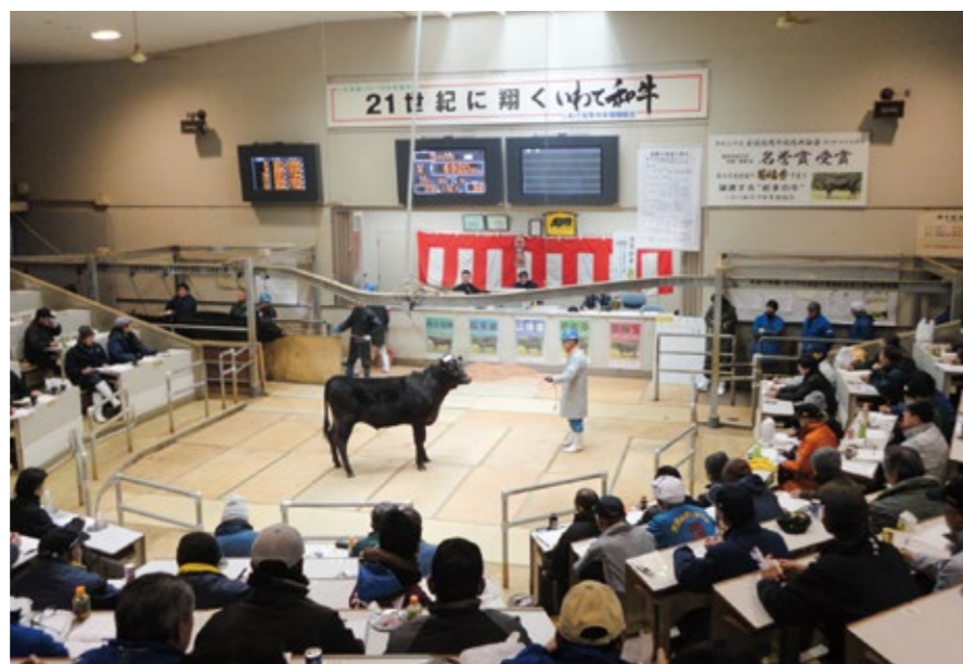
JA全農いわて中央家畜市場せり会場

8月中には給付したいと考えているが、事務の進み具合によっては、前倒しで進めたい。