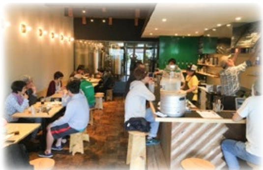
元酒屋をリノベーションし店舗兼ビール醸造所として活用している市内の事例

答(市長) 何年も放置された物件の所有者の方々は、自分の管理責任として解体していただくことは必要。相談していただくことは、やぶさかではない。