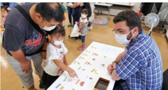
英語は勉強するのではなく遊びながら覚えるもの

業は幅が広がり、農業は技術供与により生産性が向上する可能性を秘めている。若者たちが交互に行き交うことで、波及効果は計り知れないものとなる。その中で行政は、トップセールスとして役割を果たしたい。