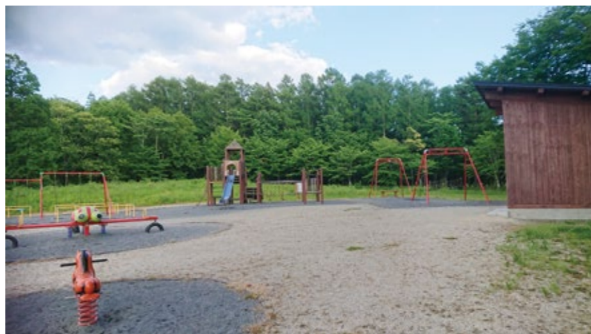
待ち遠しい遊具の充実

問 とびあ子ども木の空間整備事業の目的は。 答 とびあの子どもの遠野産材を活用して、市民生活に寄り添った憩いの場や子どもの遊び場を整備する。中心