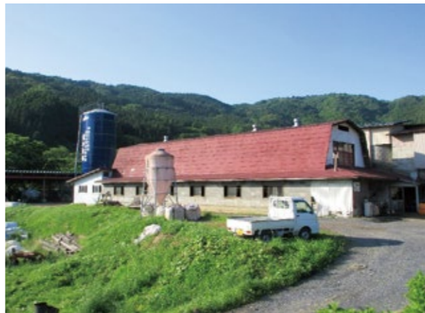
飼料価格が高止まりで大変

獣医師等人材確保は待ったなし。JA花巻、遠野市が一体となって補完して行く考えである。