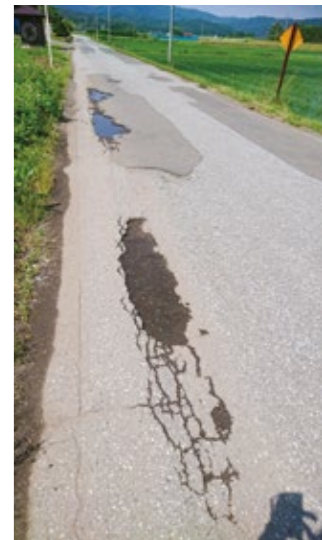
補修や改良が待たれる市内道路の一部

市長 公共工事業は今後も減少する。産業の構造改革、社会の構造改革が求められる。各事業者等、自ら事業を起すことも必要であり、市は、それに対して投資融資やコンサルなどサポートしていく。同時に必要な工事は行い、不要なもの無理に作ることはないと考えている。