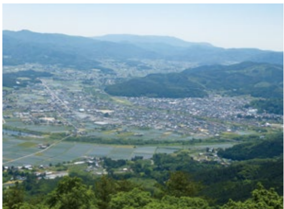
人口減少がすすみ、空き家が増加している遠野市内