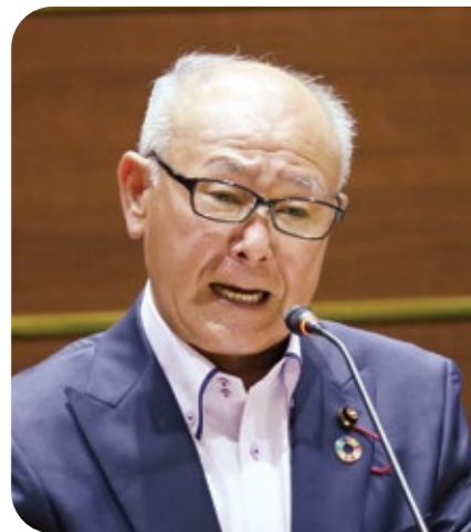
佐々木 敦緒 議員