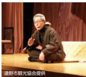
遠野市観光協会提供 語り部の熱演

問 これから伸びる当市の観光、宿泊業にリスキング「社会人の学び直し」が必要と思われるが見解は。