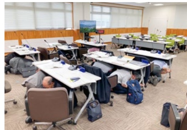
災害への備えと防災意識が大切 議会でのシェイクアウト訓練の様子