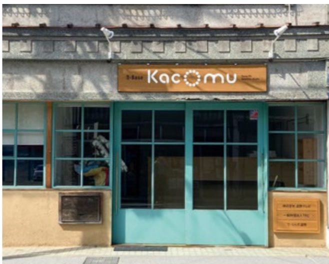
一般財団法人TRC 電話 60-1310 ご相談はこちらに

答(市長) 本事業も宣伝しなければ進まないと思っている。市民の皆様に向けて、説明させていただいて、物件の情報をいただくといいことではないと思うので、非常に重要なことだと思っている。