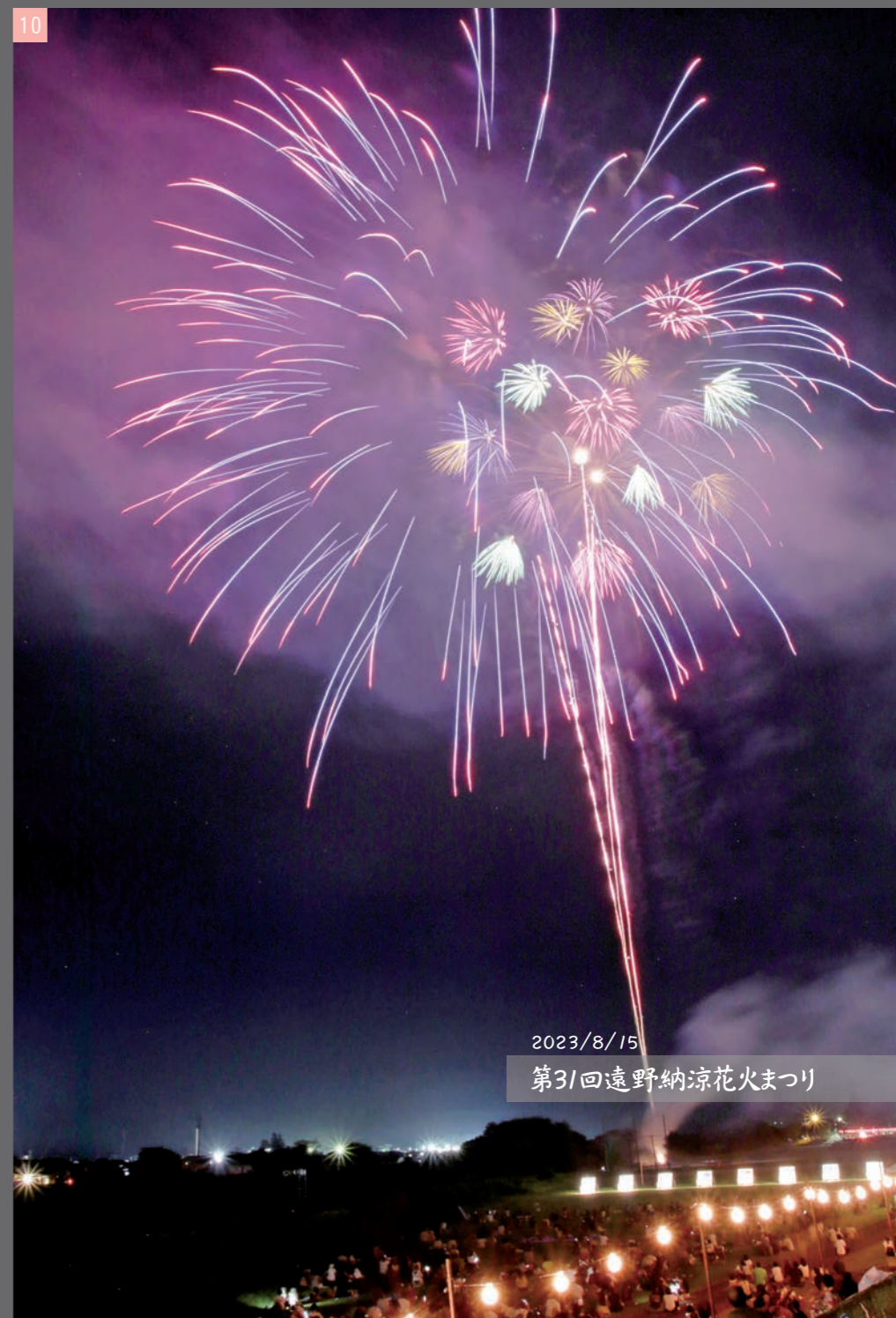
1_多くの人でにぎわいを見せた一日市商店街 2_家族との楽しい時間を過ごす 3・5_出店がまつりを盛り上げる 4_涼しげに泳ぐ金魚 6_かき氷おいしいな 7_ピアガーデン風の特設会場。話に花が咲いた 8_遠野一輪車クラブの華やかな演技 9_市民バンドの演奏が夜空に響きわたる 10_夜空を彩る約5千発の花火 11_家族と思い出を刻む 12_とびあ屋上から眺める花火 13・14_花火に思い思いの気持ちを重ねて見入る観客