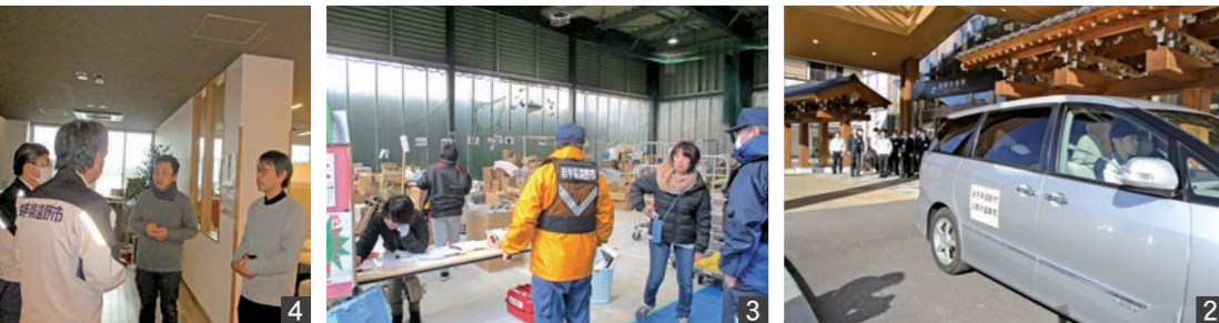
1_玉垣が崩れた七尾市の神社。輪島市や珠洲市から車で2時間ほどの同市でも家屋や道路が大きな被害を受けている 2_支援のため1月11日に出発した市防災危機管理課職員 3_金沢市の拠点に物資を搬入 4_現地の支援スタッフと打ち合わせ。今後必要な物資・支援について確認した